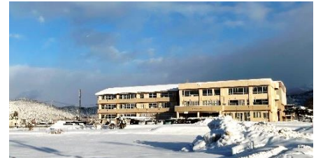
【三中校舎も冬の寒さに耐えています】

教育界も変革の時期ですが、常に「本質」は何かということを中心に置きながら、前進していく学校でありたいと考えております。本年もどうぞよろしくお願いいたします。